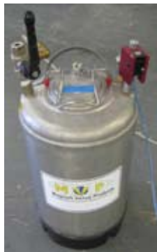
Level Sense para depósito presurizado.

Assy-0367: Level Sense Pressure Assy con Regulator