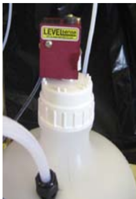
Level Sense para depósito catalizador.