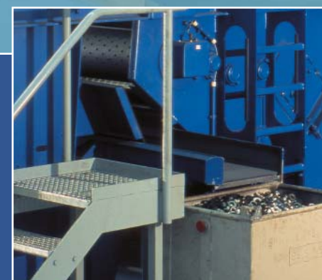
Cinta de descarga

Como una opción también le podemos ofrecer la versión con Tapiz para cargas pesadas con una cinta transportadora para fundición y aplicaciones de forja. Esta versión existe para volúmenes de carga de 300 - 2500 l y con pesos de carga de hasta 6000 Kg